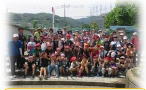
地域の方と記念撮影

でのサツマイモの苗植えに参加しました。多くの子ども達が地域の方々との交流活動を通して、「地域のために私たちも何かしたい。何ができるだろう」といった課題をもつことができました。今後は、校区にある2つのまち協や市民センターの活動などの調査活動や社会協議福祉会のウェルクラブの出前授業なども予定しています。3年生が自分達にできる地域貢献活動としてどんなアイデアを生み出すのか。今から楽しみです。