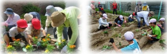
3年生の学びの振り返りの一部

○地域の人は花の手入れをしてくれているんだと思いました。地域のために私も何かしたいなと思いました。今度から、花を大切にしていきたいと思いました。