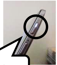
タブレット右側面