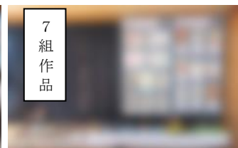
7 組 作 品