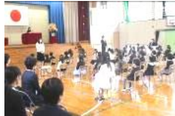
【担任の先生の紹介】

1年生が一日も早く筒井小学校での生活に慣れるようになること、また6年生の皆さんができることに挑戦しながら、これからも最上級生として、ますます活躍してくれることを期待しています。