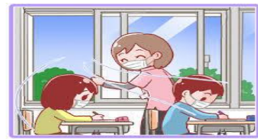
★子どもたちの様子の写真は個人情報保護の観点から、イラストに変更させていただいています（上記4枚）★

お友達との間をあけています。プリントを取るときも間隔をあけて並びます。5年生は人数が多いため、今は教室を分けて活動をしています。来週からは通常に戻りますが、給食や学習内容によっては2つの教室を使いながら3密を防いでいきたいと思っています。みんなすごい！いっぱいいっぱいほめてあげたいです。