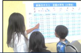
全国平均値を確認している様子

種目は、「50m走」「ソフトボール投げ」「20mシャトルラン」「立ち幅跳び」「長座体前屈」「上体起こし」「反復横跳び」「握力」です。測定結果は、体力テスト記録カードに記入し、後日、各家庭に配布しますので、ご確認ください。