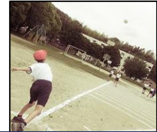
ソフトボール投げの様子