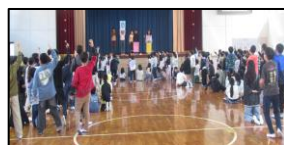
じゃんけん大会の様子