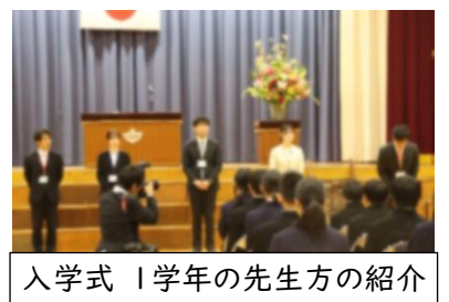
入学式 1学年の先生方の紹介