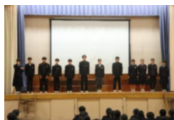
新生徒会役員あいさつ