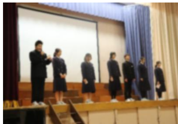
旧生徒会役員あいさつ