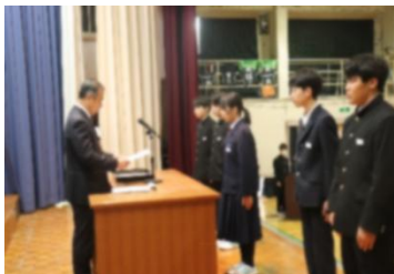
新役員へ任命書授与

2学期の終業式後に、新生徒会役員の任命式及び交代式が行われました。いよいよ3学期から新生徒会執行部のもとで、委員会活動等が行われます。よりよい高見中・生徒会活動になるよう、生徒皆で盛り上げていきましょう。