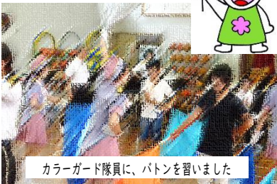
カラーガード隊員に、バトンを習いました

演奏曲は、力強い楽団とカラーガード隊の演舞が織りなす「Show me your Firetruck」や「勇気100%」。なかでも印象的だったのが高蔵小学校校歌のオーケストラ生演奏と、アンコール曲の「スーパーマリオブラザーズのテーマ」。