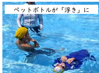
ペットボトルが「浮き」に

プールでの学習の最後は、どの学年も長袖や長ズボンを着て入水する着衣水泳をしました。「いざ」の時、服を着ていると思った以上に体の自由がきかず、おぼれてしまうことがあります。その時、どうやって冷静に自分の命を守るか…を学びました。