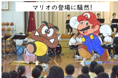
マリオの登場に騒然!