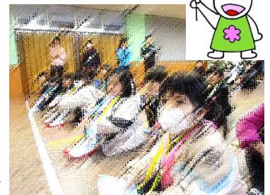
キラキラした目で、楽しそうにゲームやダンスに興じていました