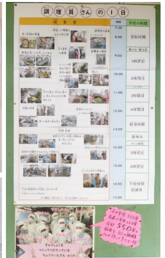
学校には、給食に関する掲示物がいっぱい