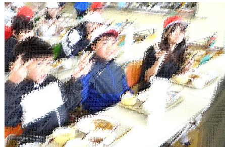
↑絶品のこんにゃくカレー。おかわり続出