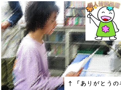
↑「ありがとうの手紙」を校内放送で読み上げる

この5日間、給食中に、人権週間の意義や、校長による人権の話、12/8太平洋戦争開戦の日の話と、各学年の代表児童による「ありがとうの手紙」の発表を放送しました。「ありがとうの手紙」には、友達や家族、先生や地域の方への日頃言えない「ありがとう」がぎっしり書き込まれていました。