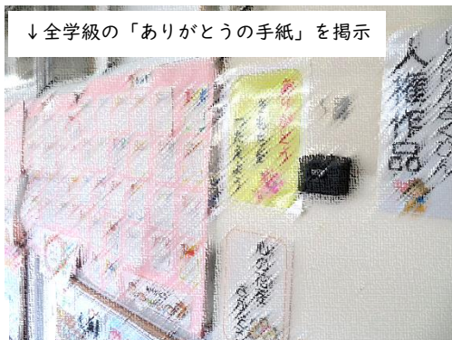
↓全学級の「ありがとうの手紙」を掲示