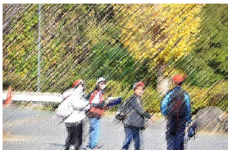
↑OLピンゴラリー、90分かけて貯水池を一周。元気があふれていました