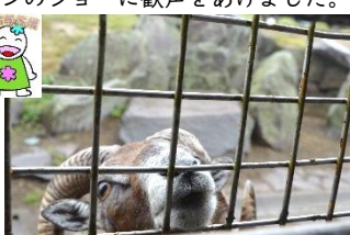
↑アフリカンサファリのジャングルバスで餌やり体験