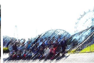
↑広大な城島高原パークで、遊び尽くしました。

2日目はまず「うみたまご」へ。ショータイムでは、カワウソやペリカンのかわいい仕草に思わず笑いがとびだしたり、セイウチの迫力のある芸にびっくりしたりしながら存分に楽しんでいました。とても大きな水槽を悠然と泳ぐ海の生き物たちの生態をグループで観察もしました。