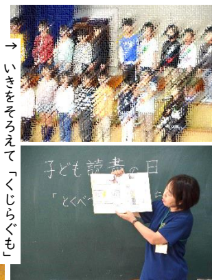
→ いきをそろえて「くじらぐも」