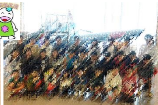
↑大刀洗平和記念館で平和集会をし、学びました。

その後、城島高原パークへ。広大な高原パークでは、たくさんの乗り物を楽しむことができ、みんな歓声にあふれ、笑顔でいっぱいでした。宿泊は、隣接する「城島高原ホテル」。夜遅くまで語らっていましたが、昼間に思う存分活動したので、子どもたちは、早々に爆睡状態でした。