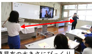
真昆布の大きさにびっくり

5年生は、家庭科の調理実習で味噌汁を作ります。その前に、食育の学習の一環で、「だし」の秘密や「うま味」について“味の素 KK”の方からオンラインで学びました。うま味の中にあるグルタミン酸は昆布に多く含まれているということで、教室の横幅いっぱい長さの真昆布の実物を見たり、味のないみそ湯にうま味を加えるとどんな味の変化があるのかを飲み比べてみたりして、うま味のよさを体感しました。