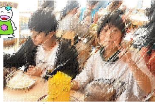
↑ホテルや見学地で、おなかいっぱい食べました。

また、午後からは「アフリカンサファリ」へ。ジャングルバスに乗って、猛獣のライオンや草食動物に肉や野菜をトングで食べさせる体験をしました。ゾウやライオンが間近に迫り来るなか、“おっかなびっくり”な様子で餌をやる子どもたちの表情が印象的で、学校ではできないダイナミックな体験に大騒ぎでした。