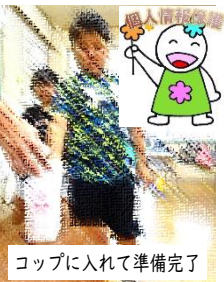
コップに入れて準備完了