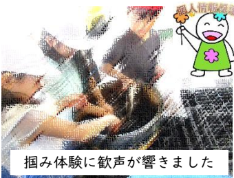
掴み体験に歓声が響きました

2年生は前回の「もっと なかよし まちたんけん」の続きで、福岡養鰻の工場を訪問しました。ウナギの養殖工場には、イキのいいウナギがいっぱい。希望者にはそのウナギを触ったり掴んだりさせてもらいました。子どもたちは、その手触りや掴んだ手からにゅると逃げようとするウナギに歓声を上げていました。また、生きたウナギを3枚に捌く様子も見せていただきました。わたしたち高蔵の町にある養鰻の工場から加工された鰻が全国各地に送られていることは感慨深いことです。高蔵のまちのよいところや誇れるところを、見て体験してもっともっと好きになってほしいものです。