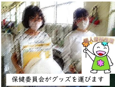
保健委員会がグッズを運びます

全国的にこの取組は行われていて、成果が上がっているとのこと。毎週の“ぶくぶくタイム”の実施で、むし歯ゼロを目指していきます。なお、当初申し込みをしていなかった子どもたちも、随時受け付けますので、担任にお知らせください。