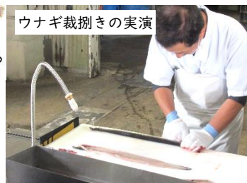
ウナギ裁捌きの実演