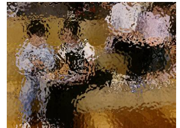
▲6年生の読み聞かせを聞く1年生たち

4月23日(水)は「子ども読書の日」でしたが、6年生の全国学力・学習状況調査があったために、本校は24日に行いました。この取組は「子どもたちにもっと本を、子どもたちにもっと本を読む場所を」との願いから誕生したものです。子どもの読書活動についての関心と理解を深めるとともに、子どもが積極的に読書活動を行う意欲を高めるため、全校で読書活動を行いました。1年生と6年生は、体育館で顔合わせした後に、図書委員会の読み聞かせや6年生が1年生に「読み聞かせ」をしてくれました。6年生がとても上手に読んでいたので、1年生は興味津々な様子で読み聞かせを聞いていました。他の学年も本の好きな場面の絵を描いたり、自分が読んだ本の紹介の新聞などを書いたりしました。