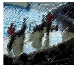
▲アシカショーを見る児童たち