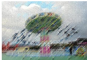
▲グリーンランドを楽しむ児童たち