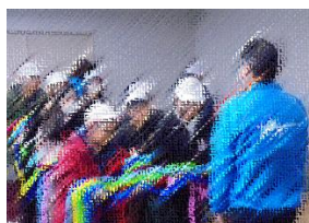
▲平和集会での折鶴の献納

11月27日(木)～28日(金)、6年生が修学旅行に行ってきました。今年も新型コロナウイルスやインフルエンザの感染状況が落ち着いた時期に感染防止対策をしながら無事に終えることができました。1日目は、まず大刀洗平和記念館での平和学習でした。平和集会を開き、平和への願いと戦没者への哀悼を込めて平和宣言をし、折鶴を献納しました。折鶴は曾根小学校の全校児童が平和への願いを込めて折ったものです。この記念館での体験が6年生から全校児童に平和を守っていく心として育って欲しいと思いました。午後からはグリーンランドに行きました。到着と同時にかなりの雨が降り出し、前途多難でしたが昼食を食べ終わる頃にはほぼやみ、若園小や清水小などが、宿泊地の関係で帰った後は、ほぼ曾根小学校の貸し切り状態でした。子どもたちは広い園内を班員と仲良く回り、様々なアトラクションを楽しみました。限られた時間を有効に使うため、事前に立てていた計画を見ながら行動している姿が印象的でした。2日目も、気持ちのよい晴天となり、福岡県青少年科学館とマリンワールドの見学をしました。展示施設は地学、生命の進化、視覚実験、コンピューター、生物のからだ、乗り物、物理、宇宙、その他オブジェの9ジャンルに分かれて展示されていました。一人一人自分の興味のある展示物で楽しんでいました。マリンワールド海の中道では、魚の生態や種類等を学び、「アシカ・イルカショー」を見学しました。この修学旅行で、6年生は公の場でのマナーや5分前行動を学び、班の仲間で教え合ったり、助け合ったりとよい判断をして行動する姿をたくさん見ることができました。事前学習を生かして6年生は、小学校生活の最高の思い出となったと思います。19日に予定しているまとめの人権・平和集会が楽しみです。