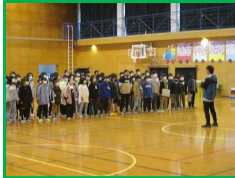
5年生：劇「かっこいい6年生」 合唱「マイ・バラード」