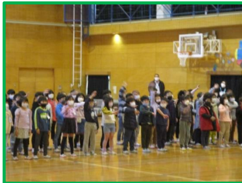
2年生：呼びかけ 歌「また会える日まで」