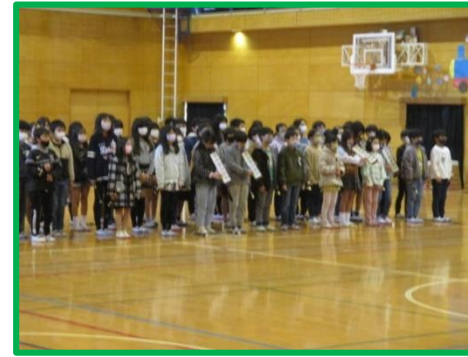
4年生：替え歌とリコーダー・三三七拍子