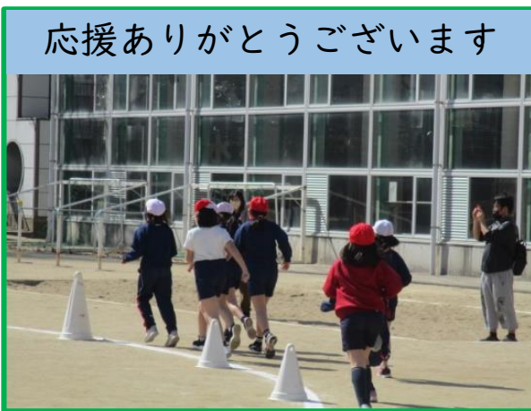
応援ありがとうございます