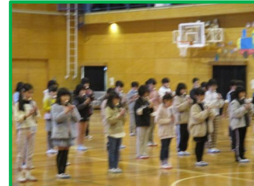
3年生：リコーダー演奏 歌「カントリーロード」