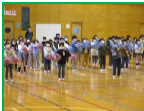
1年生：呼びかけ ダンス「サチアレ」