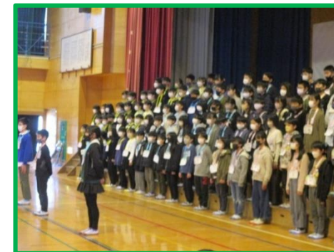
6年生：感謝の言葉 歌「僕のこと」