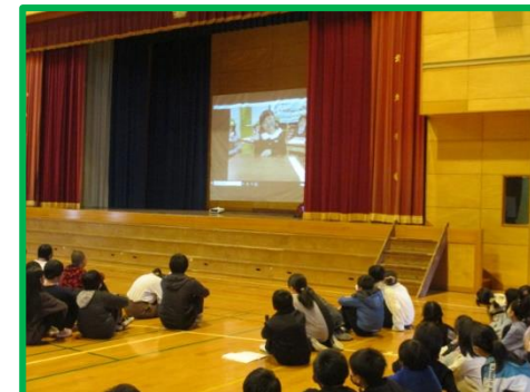
思い出のアルバム