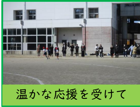
温かな応援を受けて