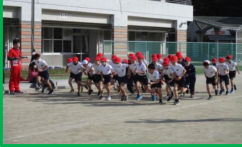
4年生男子スタート