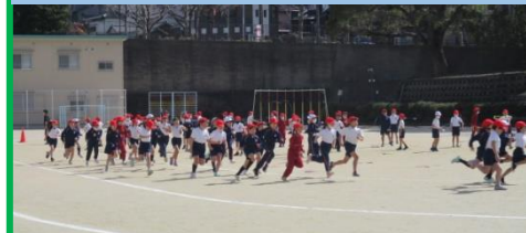
2年生女子スタート