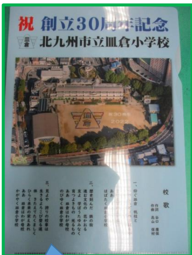
皿倉小航空写真の クリアファイル