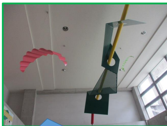
創立記念オブジェ「緑の恵」清掃