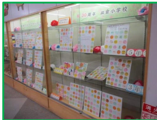
在校生のメッセージ