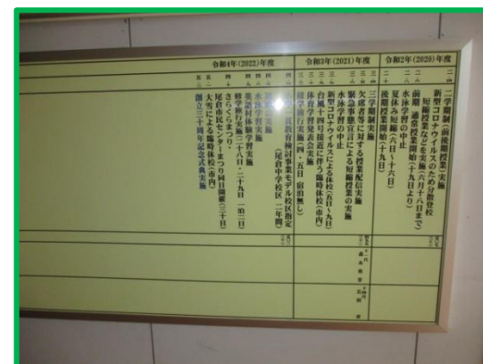
沿革史ボード取り付け 記載