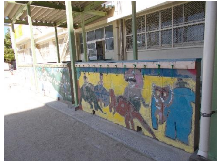
りかしつまえ ( 理科室前のかべ )