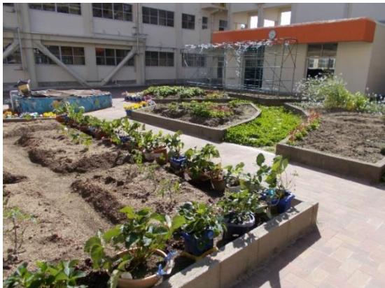
なかにわ ( 中庭 )