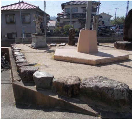
げんかんまえ ( 玄関前 )