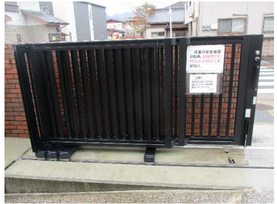
もん ( 門 )