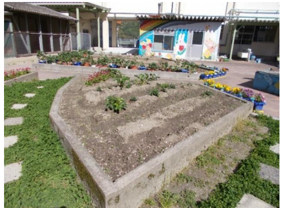
かだん ( 花壇のブロック )