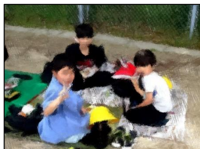
おいしいお弁当ありがとう