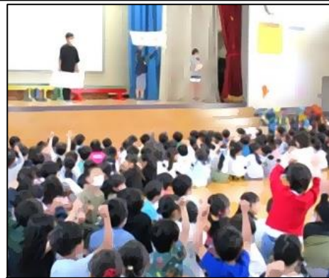
大盛り上がりの学校クイズ