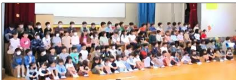
ひなだんに並ぶ1年生