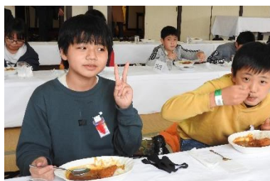
急いで食べたらずいぶん「ごちそうさま」して遊びに行きましたね。