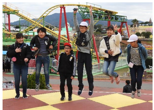
グリーンランドでの皆さんの気持ちが表れているステキな写真です。皆さん、存分に楽しんでくださいね！