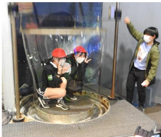
お二人の周りには、大きなシャボンが！ “ハイチーズ!!”