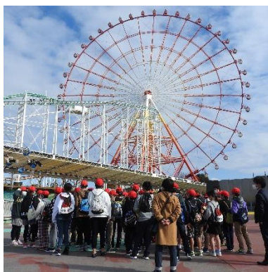
一行、グリーンランドに到着。皆さん、係員の方のお話の時、遊びたい気持ちを我慢して、最後まで説明を聞いていましたね。さすが、6年生！！