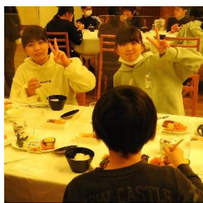
美味しい夕食です。カメラを向けられると、ステキな笑顔で“ピース!!”