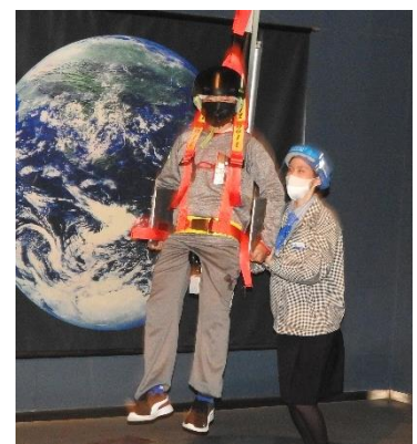
「ムーンウォーク」月面の重力ということで、体重が劇的に軽く感じるのか、高～く跳ねていましたね。