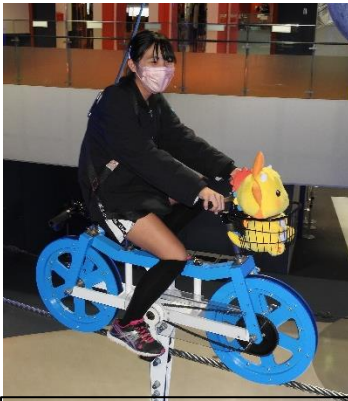
空を渡る自転車です。この画像からは分かりませんが、下を見たら足がすくむくらい高い所で漕いでいます。

佐賀県立宇宙科学館に到着です。長崎では、戦争・平和についての学習ということで、皆さん神妙な面持ちでしたが、ここからは、とびっきりの笑顔でいきましょう。