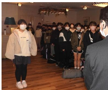
森のリゾートホテルに到着。入館式で、代表のお友だちのご挨拶です。