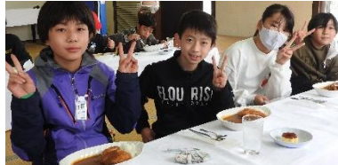
昼食は、カツカレーとプリンでしたね。ピースです。