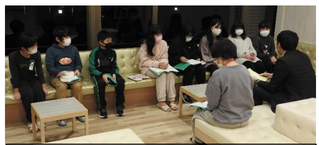
21:30よりロビーで班長会議です。1日の振り返り（反省）と明日意識することについて思いを巡らせていました。