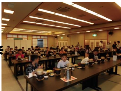
武雄温泉ハイツ(夕食)