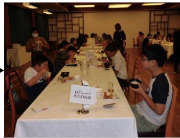
森のリゾート(昼食)