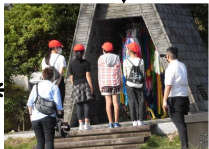
折り鶴を捧げて(平和公園)