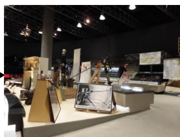
大牟田石炭記念館