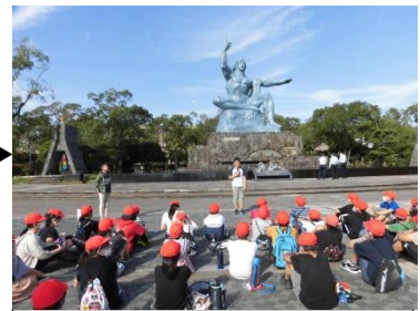
平和集会(平和公園)