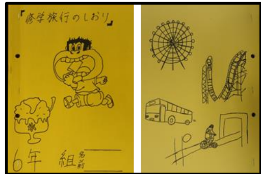
しおり係さんが作成した表紙・裏表紙

例年なら許されること、もっと楽しめるところを、今年はい我慢する場面もありましたが、総じて、6年生一人一人が自覚ある行動をとれたと思います。さらに、集団での行動の仕方、旅先でのルールやマナーの守り方など、きちんとやるべきときには真剣に取り組み、そして、楽しむときにはしっかりと楽しむ姿が随所で見られました。一生忘れられない経験をした6年生が、この旅行で得た新たな力を、今後の学校生活の様々な場面で発揮してほしいと願っています。