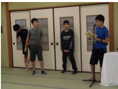
武雄温泉ハイツ(お楽しみ集会)