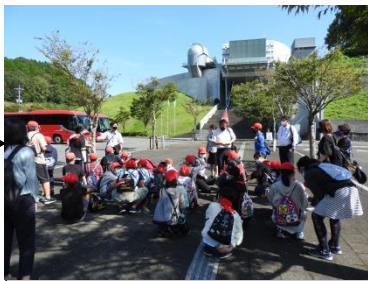
佐賀県立宇宙科学館