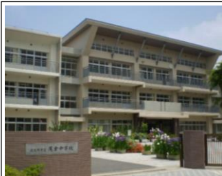
尾倉中学校だより