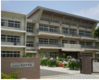
尾倉中学校だより