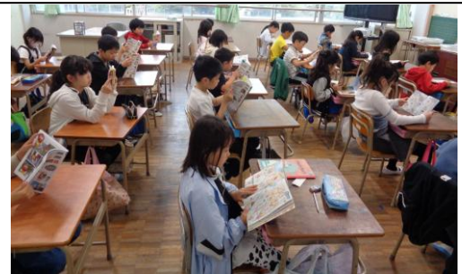
教室での読書活動

普段の学校生活でも、休み時間に雨天等のため運動場で遊べない時は、多くの子どもが図書館で読書をしています。本年度も、読書好きな子を増やすために校内の読書活動を推進してまいります。ご家庭でもお子さまが読書をするよう声をかけていただけたら幸いです。