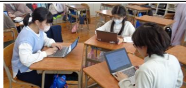
5年生 総合的な学習の時間 2年生との交流プログラム作り