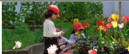
3年生 理科 春の植物の観察(撮影)

今年度も学習の中でタブレット等のICT機器を活用して、子どもたちの学びを深めていきます。