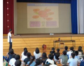
身体や脳へのダメージが大きいです