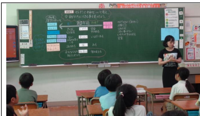
平和学習の様子 3年生

8日(火)から全校で平和学習を行いました。校内放送で平和についての話の後、各教室で平和に関する授業を行いました。今年は戦後80年に当たる年です。また、世界では、複数の地域で国家間の争いも続いています。それだけに、子どもたちには平和に関心をもち、平和を尊重する気持ちをもって成長して欲しいと願っています。