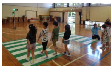
信号をしっかりと確認して渡ります