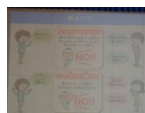
誘われてもきっぱり断ります