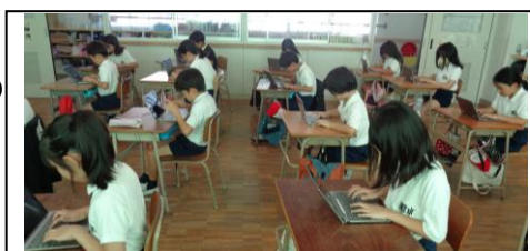
タイピングに集中して取り組む4年生

タイピングがスムーズにできると、思考の流れを中断することなく効率的な作業が可能になるとともに、作業時間の短縮にも繋がります。そのため、今後益々発達するであろう情報化社会を生きていく子どもたちに必要な技能と考えられます。今年度は、あと2回、タイピングコンテストを予定していますので、継続的に練習をしていきます。