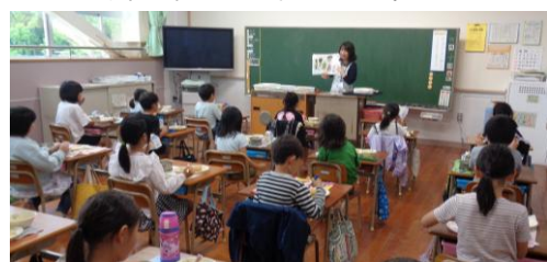
野菜もしっかり食べましょう