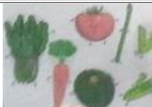
紙芝居に登場する野菜たち