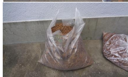
清掃活動の様子(6月6日)