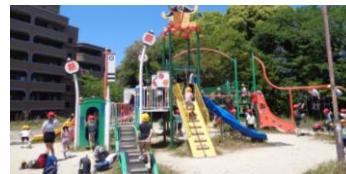
いっぱい遊びました