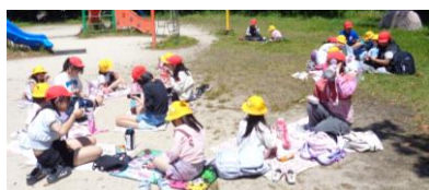
お弁当おいしかったです