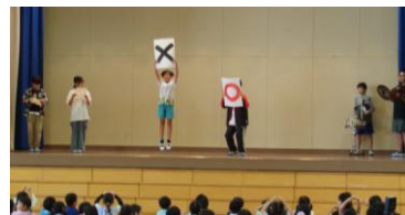
〇×クイズでたくさん正解しました