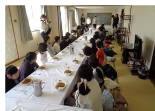
昼食はチキンカレーを味わいました