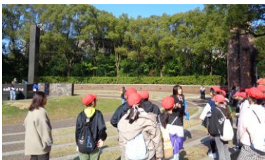
〈フィールドワーク〉原爆落下中心地