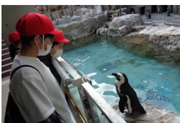
〈ペンギン水族館〉たくさんの可愛いペンギンたちに癒されました