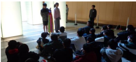
〈追悼記念館〉平和集会を行い、千羽鶴を捧げました