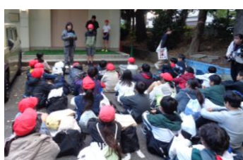
〈帰校式〉全員元気に帰校しました