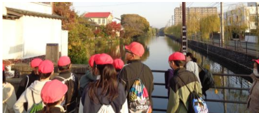
〈柳川掘割〉たくさんの水路を観ました