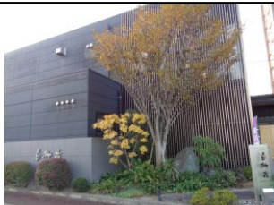
〈白柳荘〉快適な宿舎でした