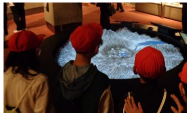
〈原爆資料館〉原爆による被害の甚大さを実感しました