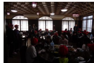
〈長崎アザレアでの昼食〉