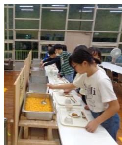
〈夕食:すべてセルフ式で、献立はカレーライスでした。大変美味しかったです。〉