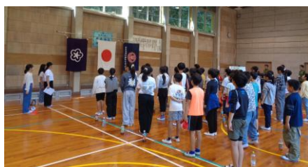
〈入所式:国旗等掲揚〉

1日目は、カヌー体験、沢遊び、ナイトアドベンチャー、2日目は、かぐめダム探検ウォークを行いました。5分前行動を守りながら友達と協力し合うとともに、自分の役割をしっかりと果たすことができ、充実した自然教室となりました。