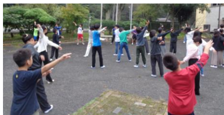
〈朝の集い:ラジオ体操と所長さんの「無患子(ムクロジ)」の話〉