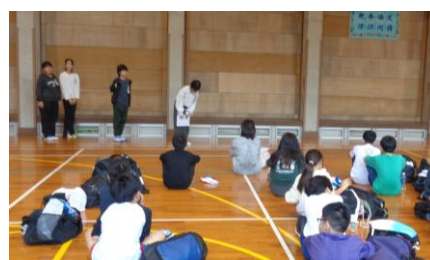
〈退所式:スムーズな司会進行ができました〉