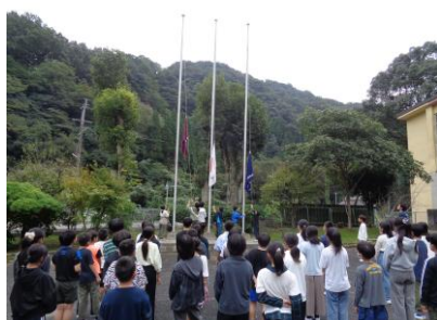
〈夕べの集い:国旗等降納〉