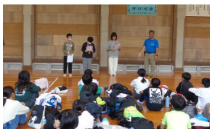
〈表彰式:「幸せの石探しの部」と「かぐめダム探検ウォーク」〉