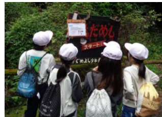
〈かぐめダム探検ウォーク:みんなで協力しました〉