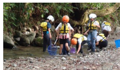
〈沢遊び:生き物や幸せの石を探しました〉