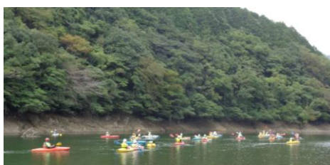
〈カヌー体験:みんな上手に漕げました〉