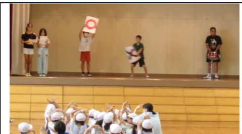
〇×ゲーム たくさん正解できました

また、計画集会委員会の児童たちも大活躍でした。集会に向けての計画や準備、そして当日の進行としっかり行ってくれました。そのおかげで、全校児童みんなが大いに楽しめた集会ができ、大きなおもいやりの花が咲いた取組となりました。