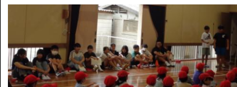
計画集会委員会の児童たち