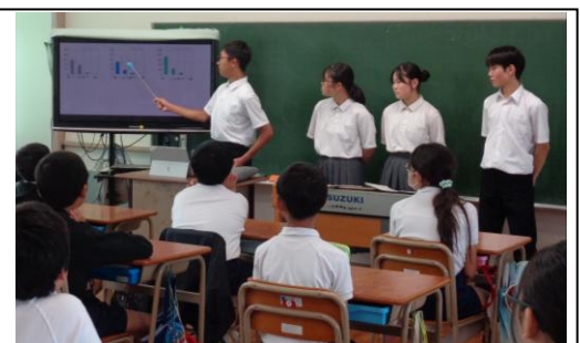
語りかけるような口調がよかったです

今回来校したのは中学2年生で、6年生が中学校に入学した時には最上級生である3年生にあたります。来春に中学校入学を控える6年生にとって、先輩となる中学生とコミュニケーションをしたり、中学校の学習の様子を感じたりしたことは、大変有意義な経験になりました。