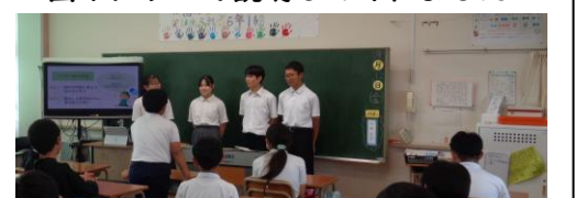
質問にも丁寧に答えてくれました