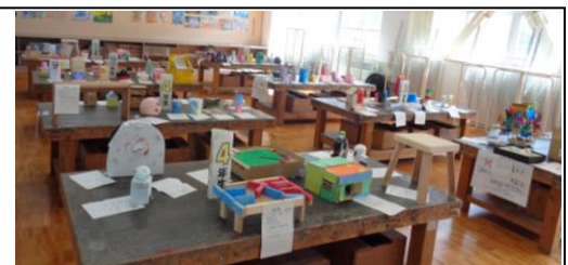
見ごたえのある作品展でした

残暑厳しい日が続いていた、8月28、29日の夏休み作品展には、多くの保護者の皆様にご観覧いただいたことに感謝申し上げます。児童たちが一生懸命に取り組んだ様子を感じることができたと思います。各学級での観覧時も、みんな友達の作品を興味深く鑑賞していました。