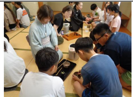
お茶を点て、友達にふるまいました

最初は緊張している様子も見られましたが、途中からは堂々とした所作で、先生方からお褒めの言葉もいただきました。