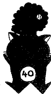
守恒小学校キャラクター もりつねっ子