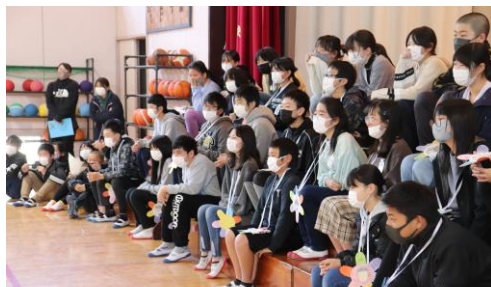
1～5年生の動画を熱心に見入る6年生

3月2日、この1年間、学校リーダーとしてみんなのためにがんばってくれた6年生に感謝の気持ちを込めて、「お別れ集会」を開催しました。今年も新型コロナウイルス感染拡大防止のため、全校では集まることはできませんでしたが、体育館の6年生と各クラスを映像と音の双方向で結び、一緒の場所にいるかのように生中継で集会をしました。在校生からは、体育館を飾る壁画、メッセージ入りメダル、お祝いのおし物のプレゼントが贈られました。先生方からは、「マツケンサンバ」のおし物もあり、温かい雰囲気の中集会が行われました。卒業式に出席できない1～4年生の「おめでとう」の気持ちも十分伝わりました。