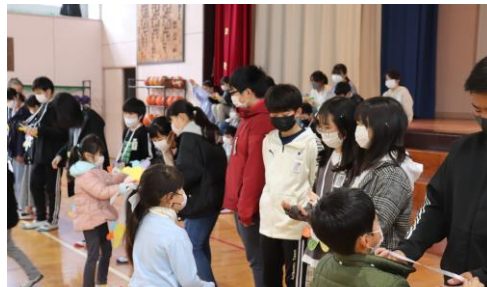
全校児童で作ったメダルを6年生に渡す1年生

1～5年生の動画を熱心に見入る6年生 全校児童で作ったメダルを6年生に渡す1年生