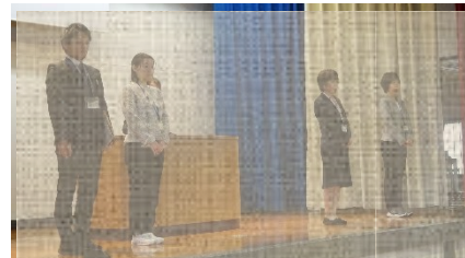
着任された4名の先生方

私ども教職員一同、「すべては子どもたちの幸せのために」を合言葉に力を合わせて全力で教育活動に取り組んで参る所存です。地域と家庭と学校と、力を合わせながら、取り組んでいきたいと思ひます。どうぞ、ご理解・ご支援をよろしくお願いいたします。