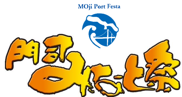
日本三大みなと祭「門司みなと祭」