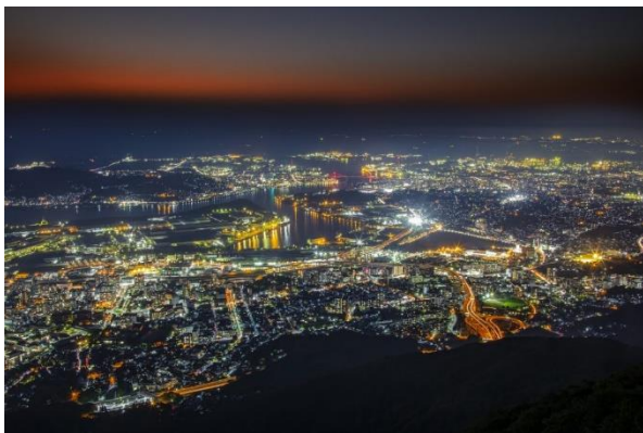
2023 日本新三大夜景都市「皿倉山」