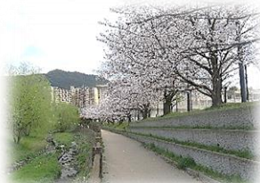
今年も満開の桜が見られました

4月8日、令和7年度の着任式・始業式を行いました。新学級の発表後、新しいクラスメートと一緒に体育館へ。まず着任式で今年度からお世話になる先生方の紹介がありました。その後の始業式。学校長式辞では、『想像力を高めよう』という話をしましたが、皆さん、よく話を聞いていました。そして新担任の発表は大きな盛り上がりを見せ、穏やかに令和7年度が始まりました。入退場の様子もきちんとしていて、今年も黒中生活躍の予感を感じる始業式でした。