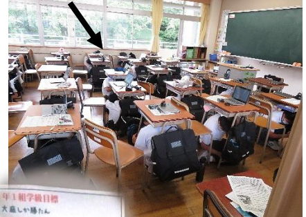
頭を守り、机の下に入っています

訓練が素晴らしいというよりも、 訓練に向かう姿勢が素晴らしい で、“さすが黒中生！”と思ったひと時でした。