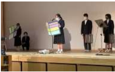
まぶろはん ばっびょう ようす 作業班ごとに発表する様子

10月17日(月)から28日(金)までの2週間、高等部の後期産業現場等における実習が実施されました。1年生は校内実習、2・3年生は校外実習を行いました。11月7日(月)に行われた実習報告会では、成果と課題を発表しました。2・3年生の発表にあたっては、いくつかの選択肢から発表方法や場所等を「自分で選び」、実行することができました。「自分で選び、自分で決める」ことは、自立していく上でとても大切なことです。日頃から意識して生活できるといいですね。