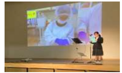
ステージでPCを使って発表する様子