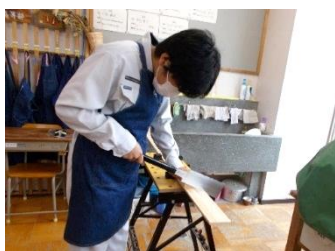
もっこうはん 木工班