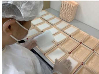
しゅうろうけいぞくしえんB型 就労継続支援B型