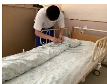
きぎょう かいごろうじんほけんしせつ 企業 介護老人保健施設