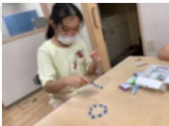
せいかつかいご 生活介護 のんびり学園