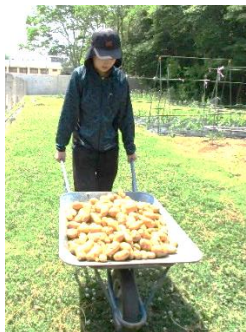
のうこうはん 農耕班

5月23日(月)から6月3日(金)までの2週間、高等部の前期産業現場等における実習が行われました。1年生は、 のうこうはん もっこうはん ぶん に分かれての作業や就労専門家の指導による清掃サービス等の校内実習を行いました。2・ 3年生は、せいかつかいご しゅうろうけいぞくしえん がたどう けいたい こうがいじっしゅう けいけん がくねん こじん もくひょう いしきとく 生活介護や就労継続支援B型等の形態での校外実習を経験しました。学年や個人の目標を意識して取り組み ました。