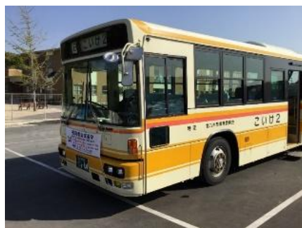
こいけ1、こいけ2 どちらも黄色のバスです。