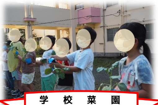
学校菜園 ～冬のお野菜～