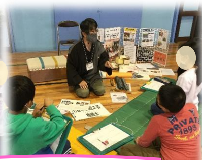
夢授業 ～キャリア教育～