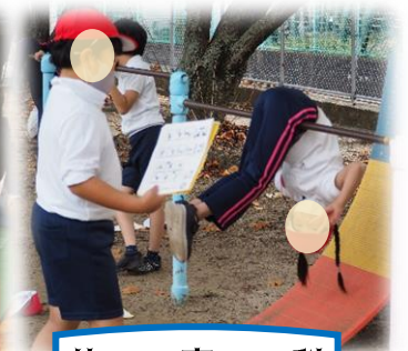
体育科 ～鉄棒・ラグビー～