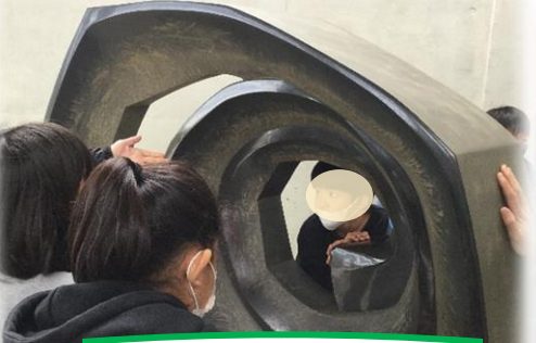
ミュージアムツアー ～北九州市立美術館～