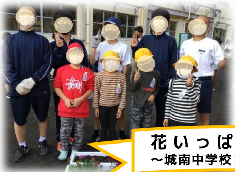
花いっぱい運動 ～城南中学校2年生と～