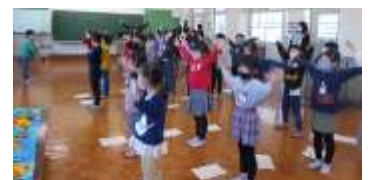
1年生の練習の様子。