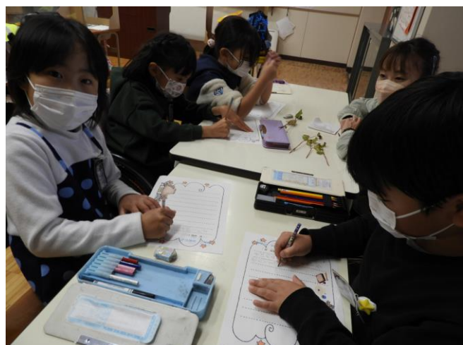
活動後の振り返り 感じたことや分かったこと を友達と交流します。