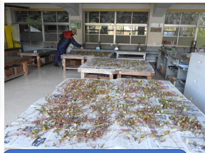
収穫した実はしばらく乾 燥させます。