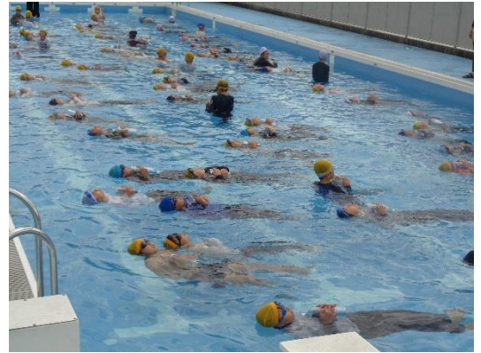
<ペットボトルで身を守る着衣泳の様子>

この楽しみを実現するためにも、病気や事故などに気を付けて健康に過ごして欲しいと思います。