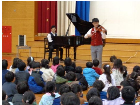
< エバリー コンサート >

2学期は、通常の学習だけでなく、校外学習や出前授業など日頃経験できない学習に取り組みました。先日、1年生から3年生までに行われた「エバリー」のコンサートでは、一瞬にして子ども達が一