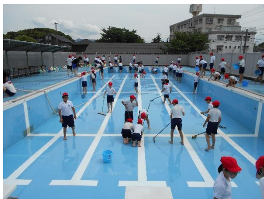
6/12(月) 6年生によるプール清掃

梅雨時期で実施が心配される水泳学習ですが、比較的天候に恵まれスムーズに実施できています。6年生がプール清掃をしてくれたおかげで、気持ちよく泳ぐことができます。キラキラポストにも、6年生への感謝の言葉が入っていました。教職員は、命を守るため事前に AED 講習会を実施しました。