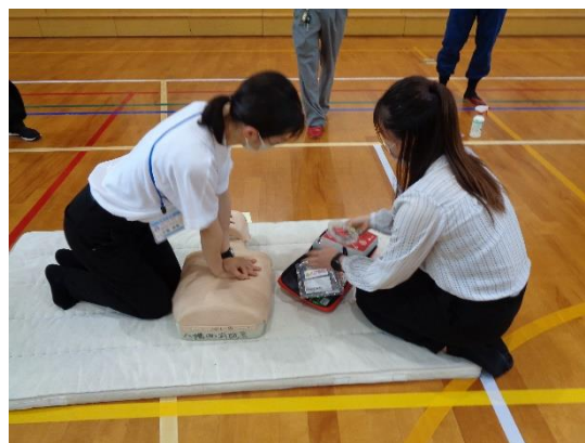
6/2(金) 教職員による AED 講習会