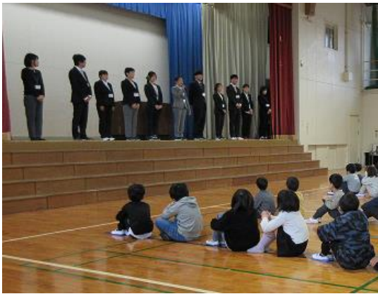
11人の先生が日明小学校に赴任されました。

新型コロナウイルス感染症予防のための制限が解除されたのが昨年5月ですから、解除後初めての新年度のスタートです。昨年度の反省を生かし、子どもたちの健やかな成長のため教職員一同、力を合わせて努力していきます。今年度もどうぞ、よろしくお願いいたします。