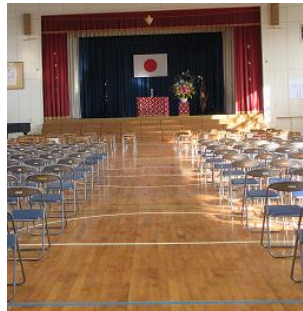
65名の新入生を迎える朝。